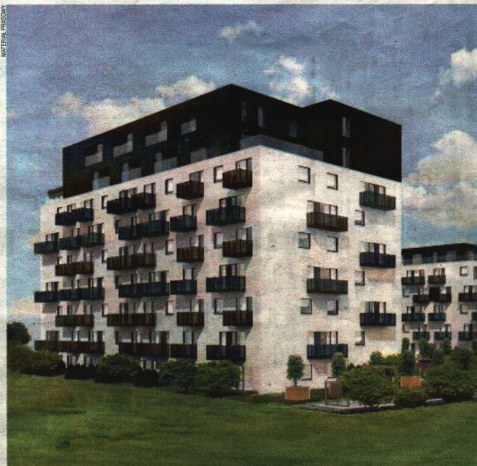
Osiedle Zielony Marcellin

W przyszłym roku przy ul. Walbrzyskiej 7 powstanie I etap osiedla Zielony Marcellin z 99 mieszkaniami. W sumie w całym kompleksie zaprojektowano 201 mieszkań o zróżnicowanych powierzchniach, od 35-metrowych kawalerek po 135-metrowe apartamenty. Na parterze znajdują się lokale przeznaczone na usługi. Każde z mieszkań posiada balkon lub ta-