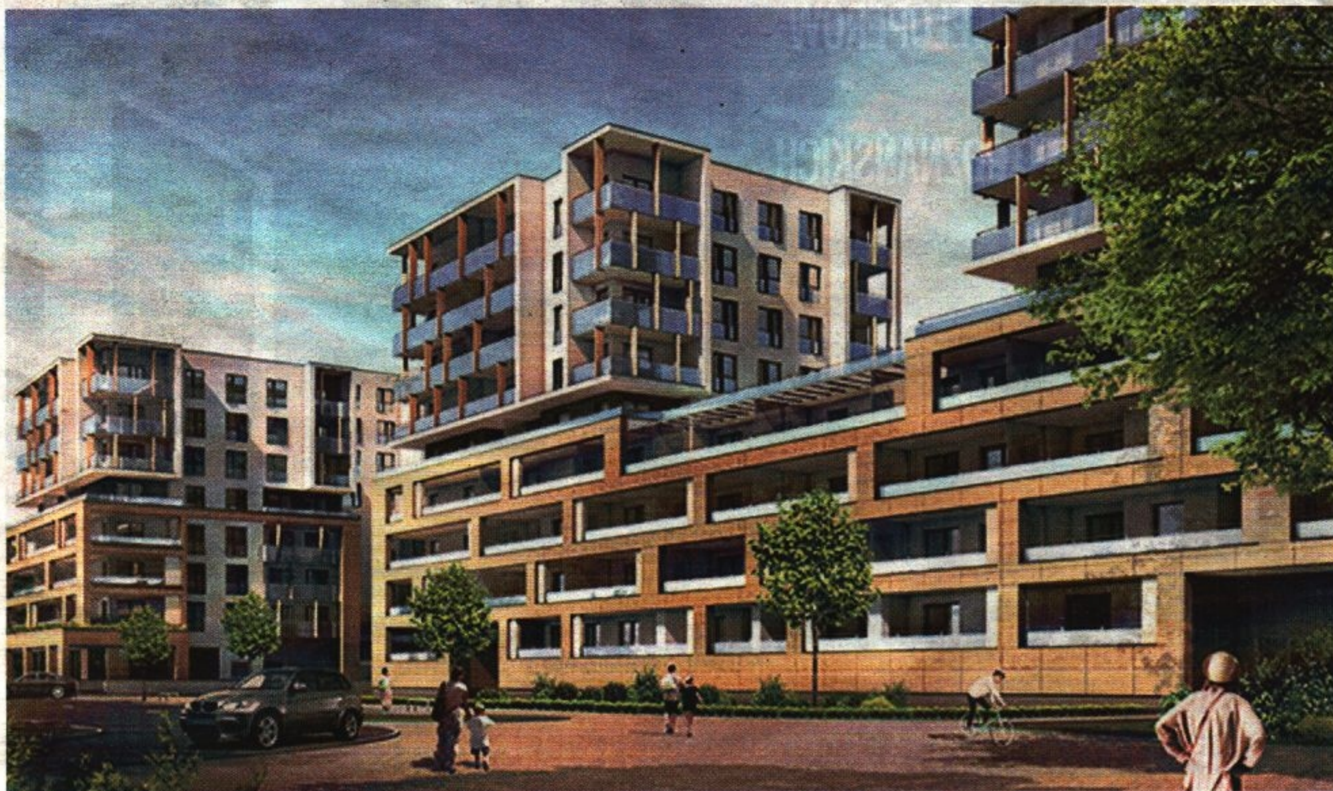
Osiedle Nowy Marcellin

Targi Mieszkań i Domów i jedyna okazja, by w jednym miejscu poznać niemal pełną ofertę nowych osiedli w Poznaniu i pod miastem.