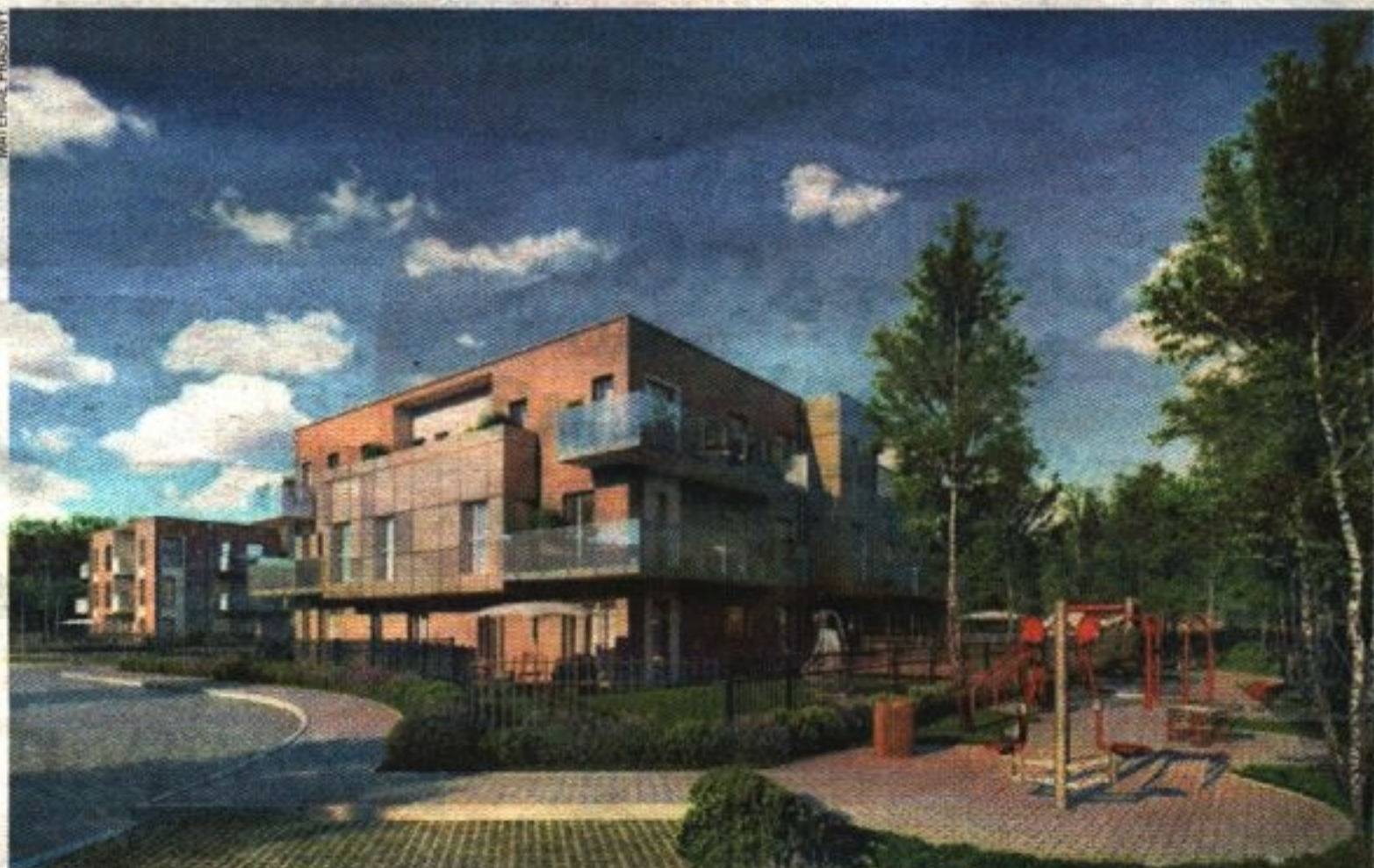
Osiedle Strzeszyn 2