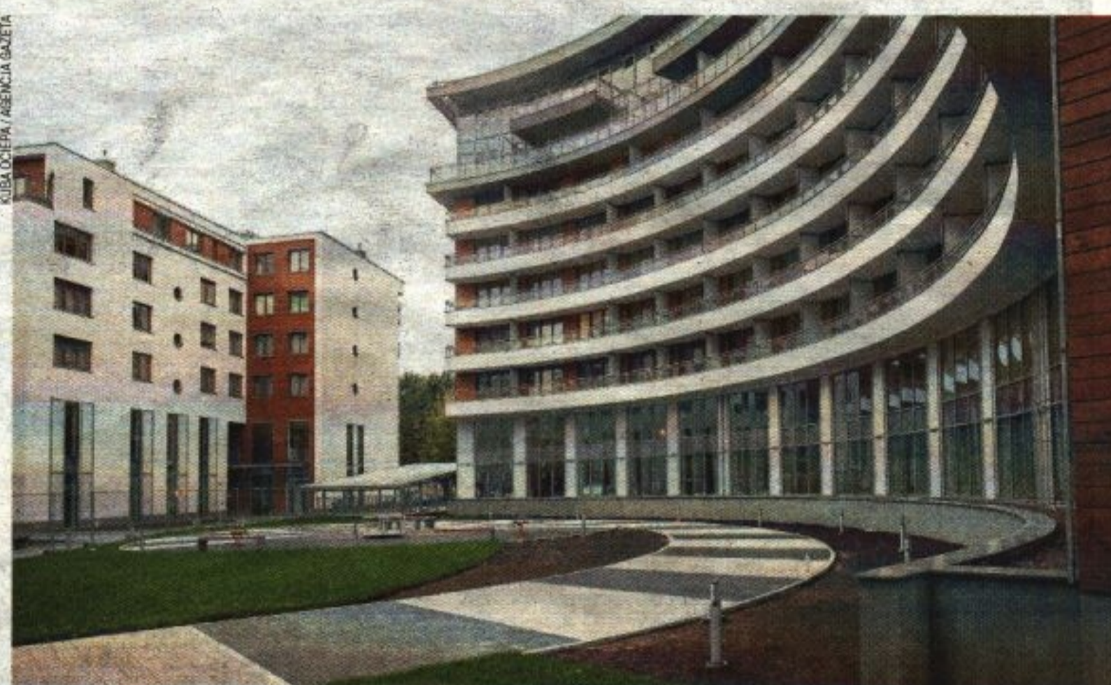
Dla kupujących nadal kluczowa jest dobra lokalizacja, atrakcyjna również pod kątem bliskości terenów zielonych. Nabywcy chętniej kupują mieszkania u sprawdzonych deweloperów, którzy mają wieloletnie doświadczenie

W ubiegłym roku sprzedaliśmy 260 mieszkań osiągając założony plan. W II kwartale 2016 roku, rozpoczęliśmy realizację pierwszego etapu ka-