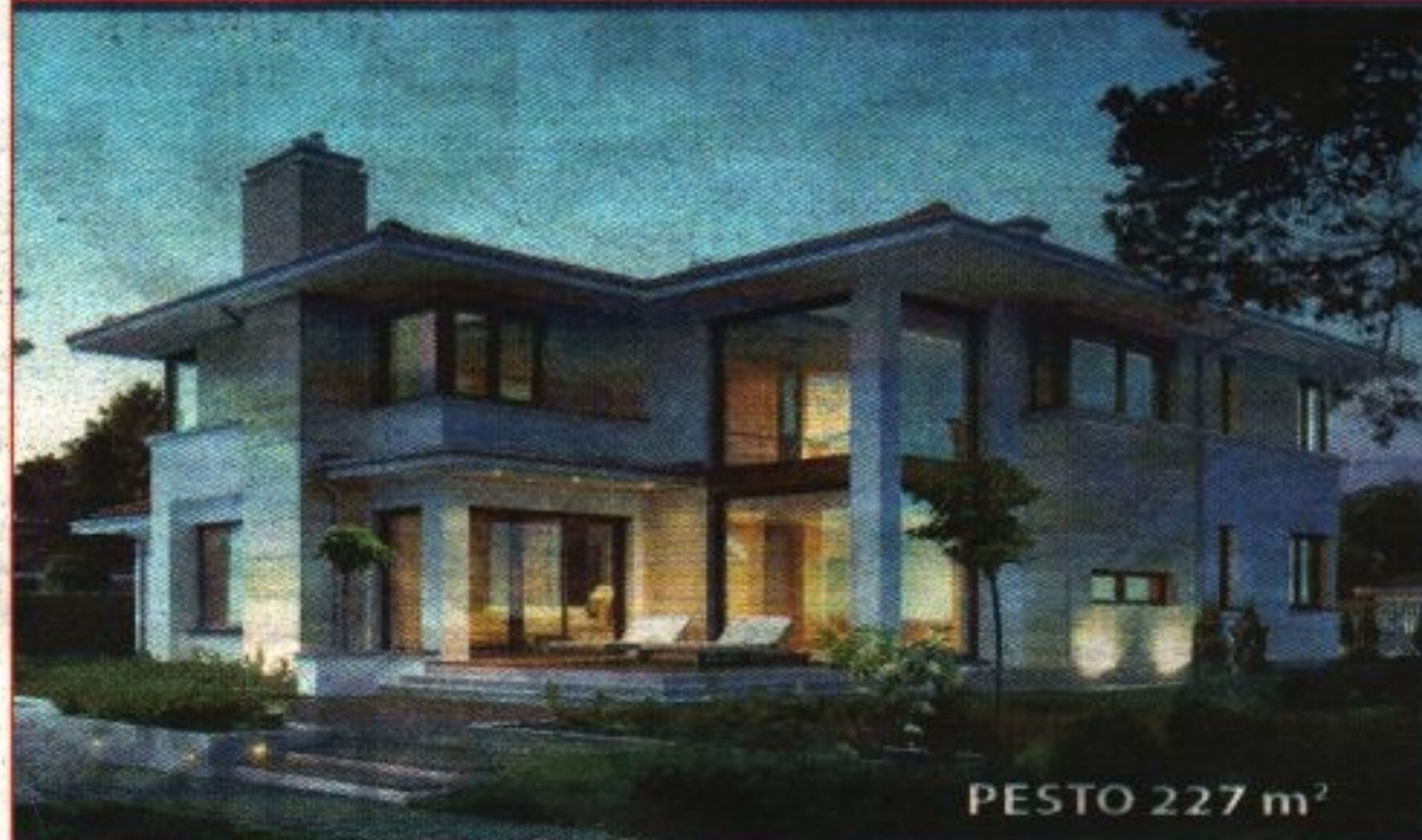
PESTO 227 m 2

NA SPRZEDAŻ DOMY JEDNORODZINNE I BLIŹNIACZE W POZNANIU