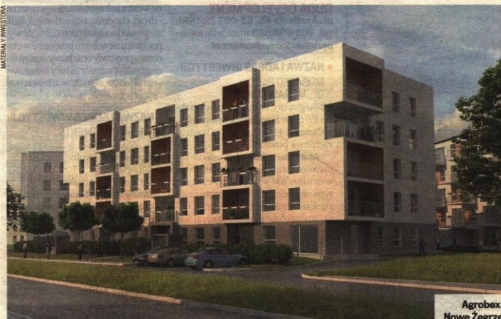
Agrobex. Nowe Zegrze

ATANER ul. Towarowa 35, 61-896 Poznań, biuro@ataner.pl, tel. 61 859 40 04