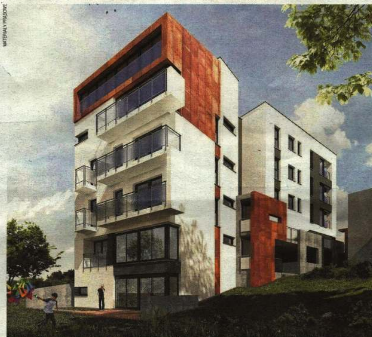
Przystań Warta na Starołęce to budynek z kategorii „premium”

W sumie Nowy Marcecin składać się będzie z trzech monitorowanych osiedli z portierniami ochrony, pla-