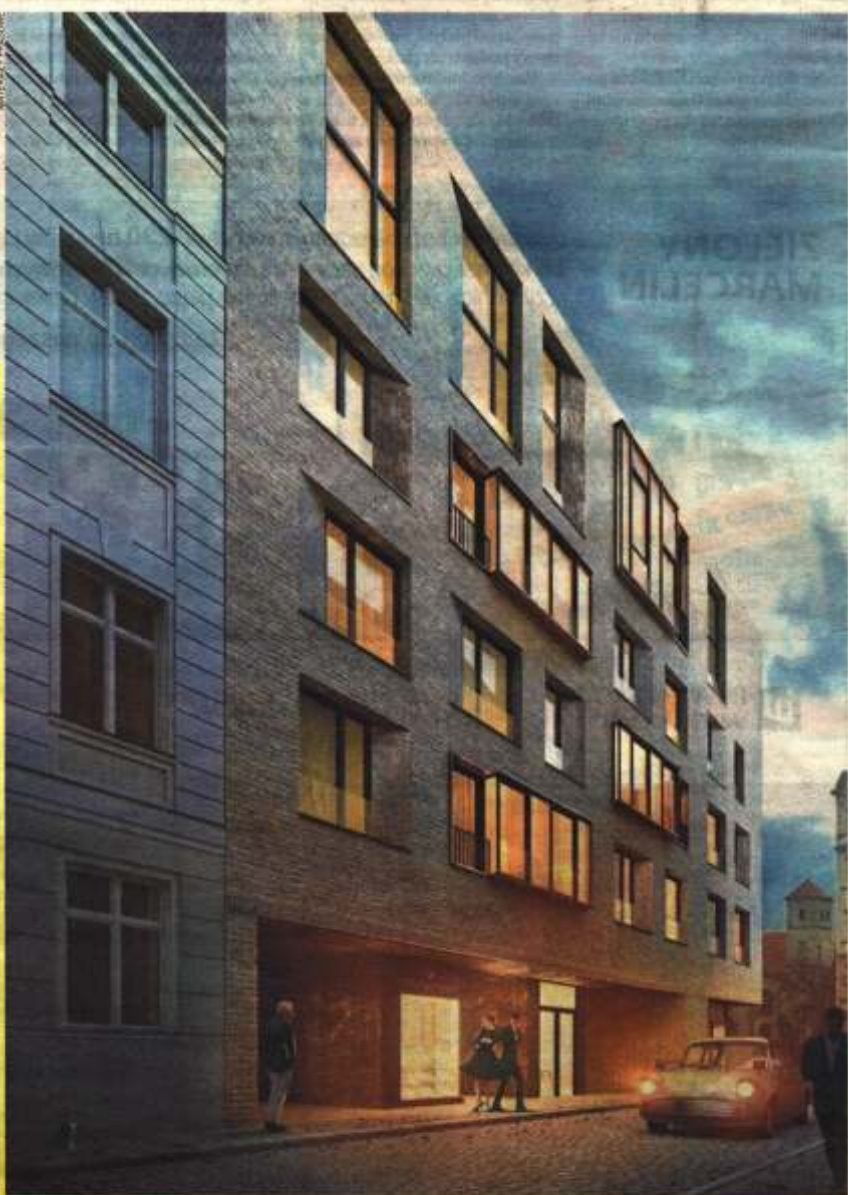
Nowy budynek przy ul. Za Bramką

W części wysokiej na trzech dolnych poziomach znajdują się lokale usługowe i biura, a powyżej - 180 mieszkań o powierzchni od 30 do 140 m kw. z balkonami (na wyższych piętrach z ogrodami zimowymi) i panoramicznymi oknami. Pod budynkiem znajdować się będzie hala garażowa ułatwiająca wygodne parkowanie w centrum z 230 miejscami parkingowymi. Natomiast na dachu budynku znajdzie się 180-metrowy taras przeznaczony wyłącznie dla mieszkańców (będzie tu zieleń i przede wszystkim widok na panoramę Poznania). Ponadto na parterze wszyscy fani sportu będą mogli poćwiczyć na siłowni, także przeznaczony tylko dla mieszkańców budynku.