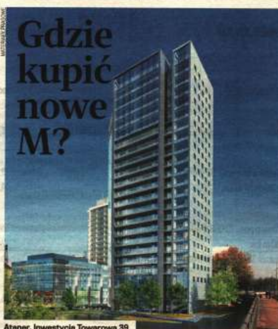
Ataner. Inwestycja Towarowa 39