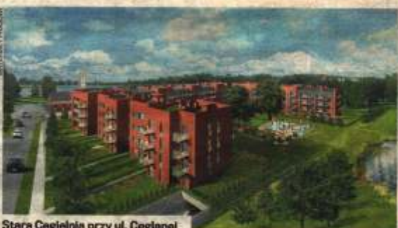
Stara Cegielnia przy ul. Ceglanej