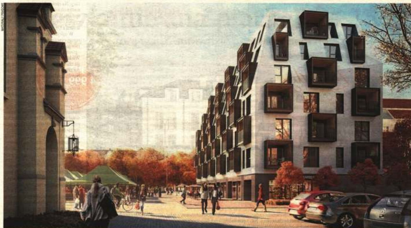
Rynek Wildecki 3