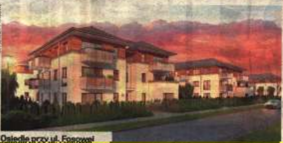
Osiedle przy ul. Fajrowej

czonyj na biura. W części wysokiej znajdują się mieszkania od 30 do 107 m kw. z balkonami, ogrodami zimowymi i panoramicznymi oknami, które zapewnią bardzo dobre oświetlenie i niezmierny widok na Poznań. Budynek jest monitorowany i wyposażony w podziemną halę parkingową, umożliwiającą wygodne parkowanie w centrum. Na dachu budynku znajdować się będzie taras o powierzchni ok. 180 m kw. przeznaczony wyłącznie dla mieszkańców, gdzie będą mogli odpocząć wśród zieleni i fantastycznym widokiem na Poznań. W budynku znajdzie się także siłownia, również przeznaczona tylko dla mieszkańców. Oczywiście atutem