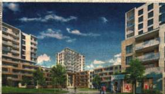
Ataner. Osiedle Nowy Marcecin